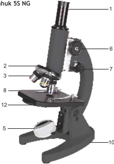
Levenhuk 5S NG